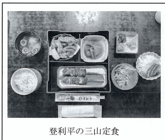
登利平の三山定食

隣にはフラッグショップの本館「シャトー・デュ・ボヌール」があり、そこでラスクやケーキなどのお土産を購入することができました。